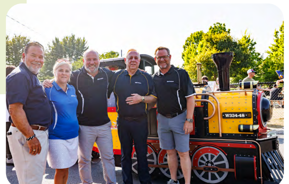
Ils étaient aussi présents à l'épluchette de blé d'Inde.