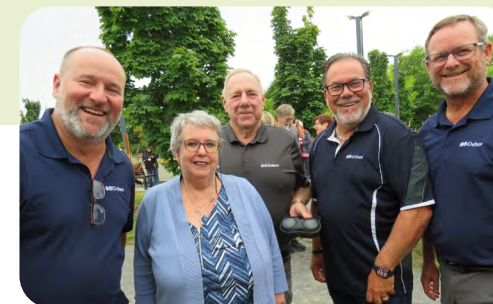
Les élus participent chaque année au tournoi de pétanque du Club de l'âge d'or.

Cette politique de proximité permet au conseil municipal de prendre des décisions éclairées, ancrées dans la réalité du milieu et adaptées aux besoins de la communauté.