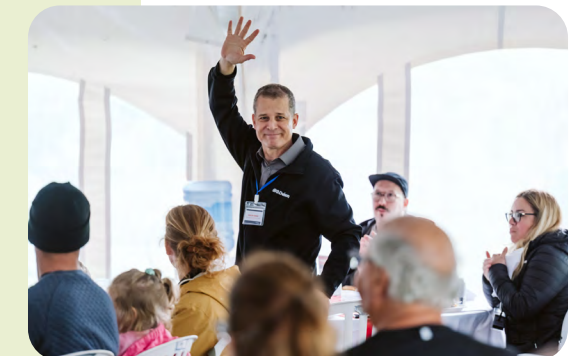
... en passant par le BBQ du conseil municipal, vos élus vous accompagnent.