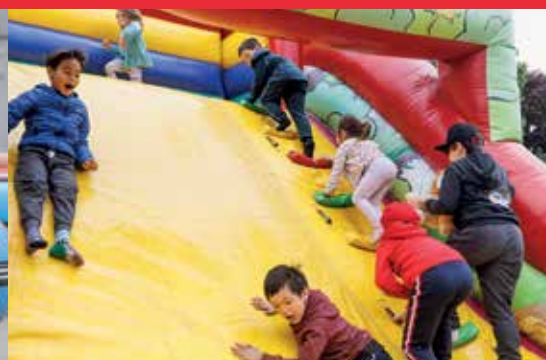
Familles en fête a attiré plus de 500 citoyens, le 20 mai dernier, au parc Arthur-Trudeau.