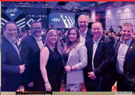
Nos élus et le directeur général aux Assises de l'UMQ