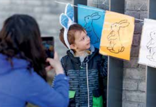
Chasse aux cocos de Pâques