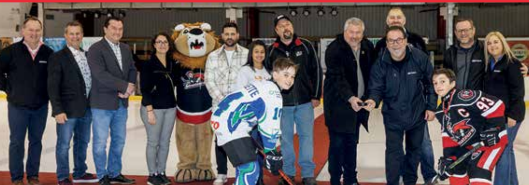
Mise au jeu officielle du 32 e tournoi interrégional N.A.P. de Delson