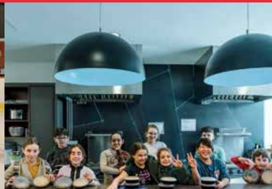
Atelier de cuisine lors de la relâche